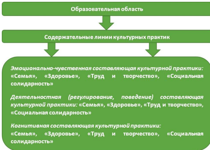
Рис. 2. Модель реализации содержания образовательной области

• «Социальная солидарность» – свобода личная и национальная, доверие к людям, справедливость, милосердие, честь, достоинство.