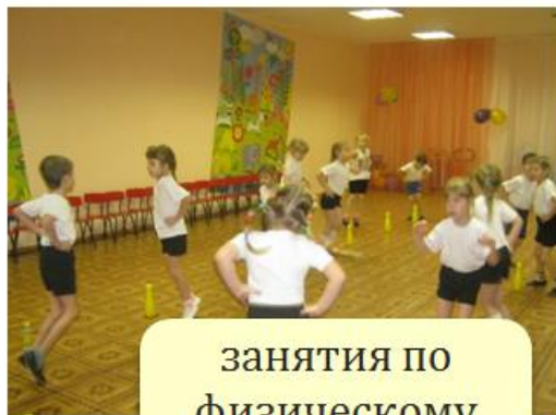
занятия по физическому развитию