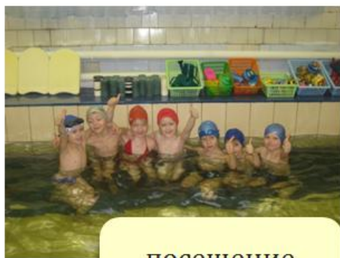
посещение бассейна д/с